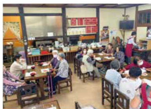
つづみの里内の中華料理店をお借りして「よりあい喫茶“わ”」を開店