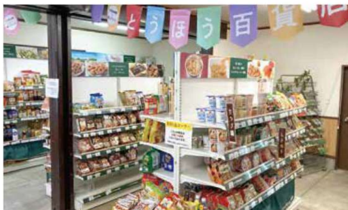
常時600点の食料品・日用品を取り扱う「とうほう百貨店」コーナー

今後も、それぞれの強みを活かした協働により、村民が必要とする買い物の場の提供を継続していく。