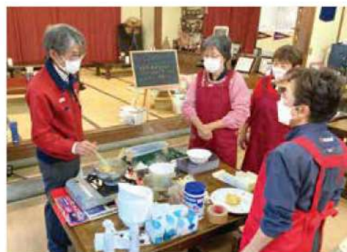
エフコープ生活協同組合の指導による、高齢者も調理しやすい食品の試食会を実施