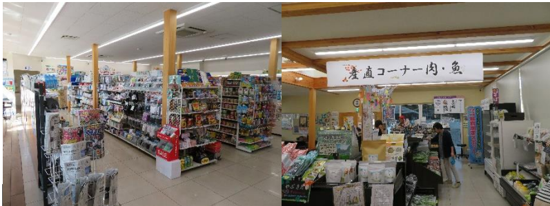
コンビニエンスストア×農産物等直売所