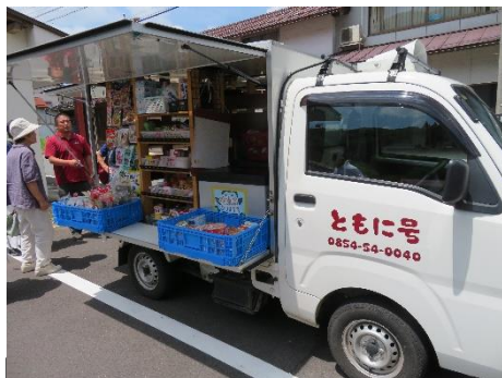
移動販売×ともに食堂