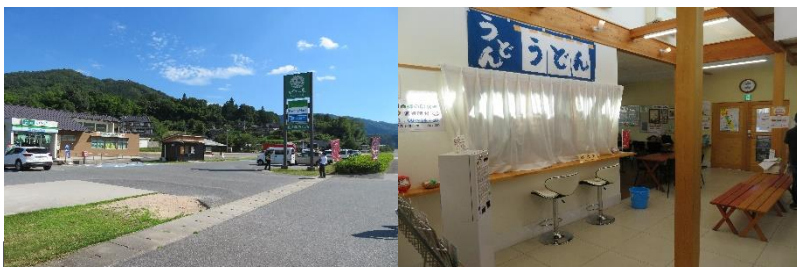
敷地の広さ×買い物以外にも多機能